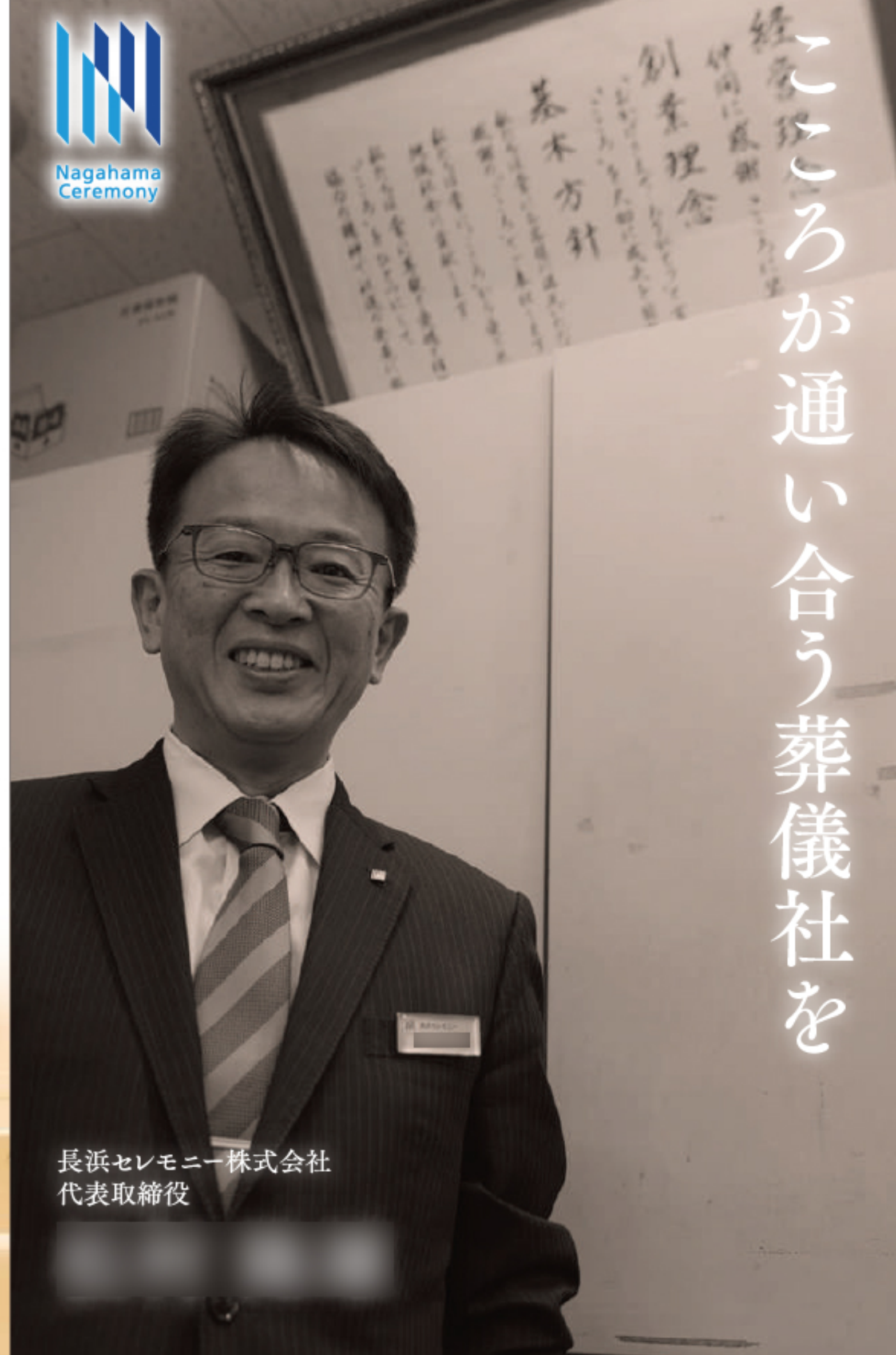
長浜セレモニー株式会社 代表取締役